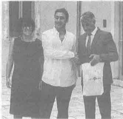
Marin Maras autor je najbolje fotografije iz Zadarske županije

Na natječaj se javilo čak 2.000 autora s 3.667 fotografija čime je srušen prošlogodišnji rekord kada je pristiglo