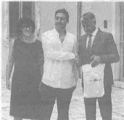
Marin Maras autor je najbolje fotografije iz Zadarske županije

Na natječaj se javilo čak 2.000 autora s 3.667 fotografija čime je srušen prošlogodišnji rekord kada je pristiglo