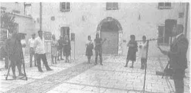
Izložbu je otvorio župan Božidar Longin

iz Osječko-baranjske županije. Najbolje fotografije birala je i publika, a kako je ove godine u toj kategoriji pristiglo puno glasova nagrađena su dva autora: Hrvoje Jurković iz Ličko-senjske županije i Matko Begović iz Splitsko-dalmatinske županije. Za najbolju