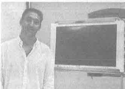
Marin Maras i fotografija »Odlazak«

2.150 fotografija, što, kako je istakla Milin, nije bilo ni manje nego lako za obraditi i procijeniti koja će se fotografija okititi laskavom titulom najbolje.