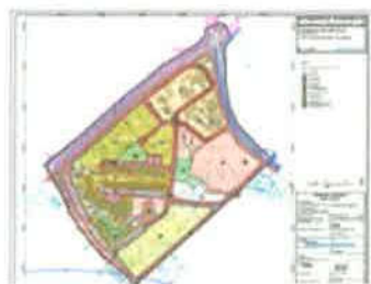
1. NAMJENA POVRŠINA