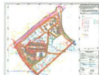
2B. ELEKTROENERGETSKI SUSTAV I TK