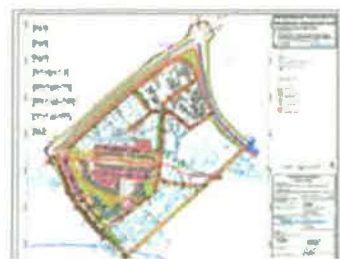
2A. PROMETNA INFRASTRUKTURA