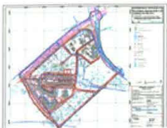
2C. VODNOGOSPODARSKI SUSTAV