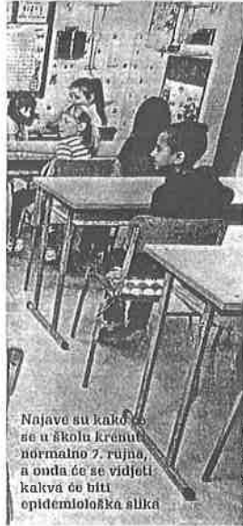
Najave su kako će se u školama krenuti normalno 7. rujna, a onda će se vidjeti kakva će biti epidemiološka slika