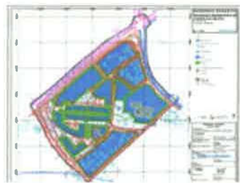
4. NAČIN I UVJETI GRADNJE