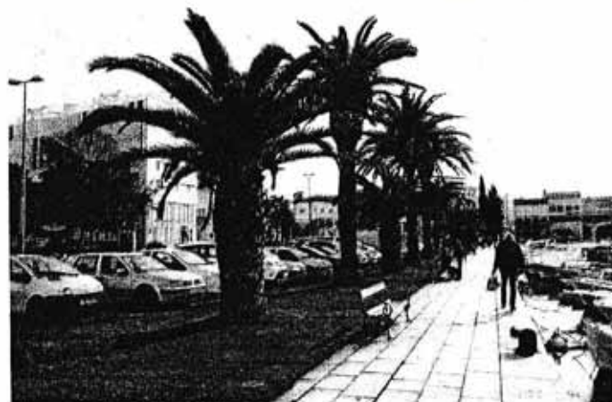
Palme su simbol šetnice u Jazinama

– Kroz idućih godinu do dvije očekuje se realizacija i tog projekta, rekao je Škibola.