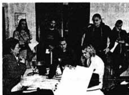
Liječnička provjera prije darivanja krvi

– Planirali smo od 16 do 18 sati no kako nam je došlo više ljudi akcija je produ-