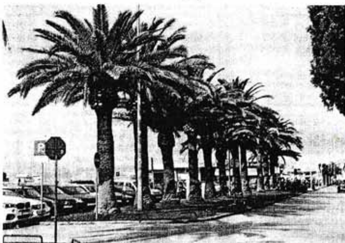
Randi se Elaborat izvada u stanje 15 palmi na Branimirovoj obali

skih stablašica utvrditi stručne službe.