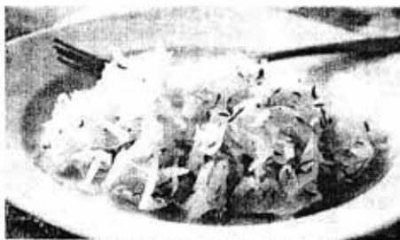
Običaj posipanja kupusa kimlom dobar je za probavu