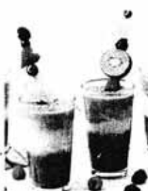
Popularni 'smoothieji' nisu najbolji izbor za zajutak, kažu stručnjaci