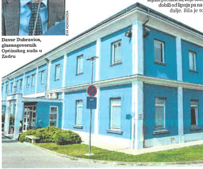
Općinski sud u Zadru

Zbog ovakve situacije najviše pate građani koji, ukoliko je njihov predmet delegiran Splitu, i zbog najstalnijeg prekršaja moraju na ročište u drugi grad. Ostaje stoga nadati se kako će spajanje općinskih i prekršajnih sudova dovesti do još bolje učinkovitosti u rješavanju predmeta, što je u konačnici i bio cilj ove odluke.