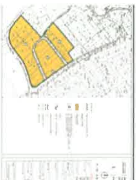
KORIŠTENJE I NAMJENA POVRŠINA