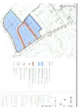
UVJETI KORIŠTENJA, UREĐENJA I ZAŠTITE POVRŠINA