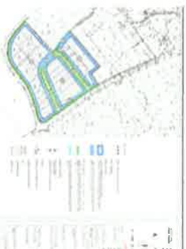
NAČIN I UVJETI GRADNJE