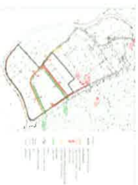
ENERGETSKI SUSTAV I EKI