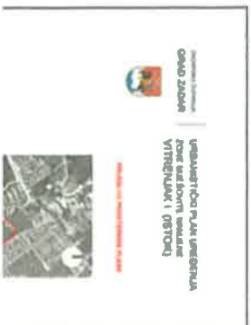
TEKSTUALNI DIO PLANA