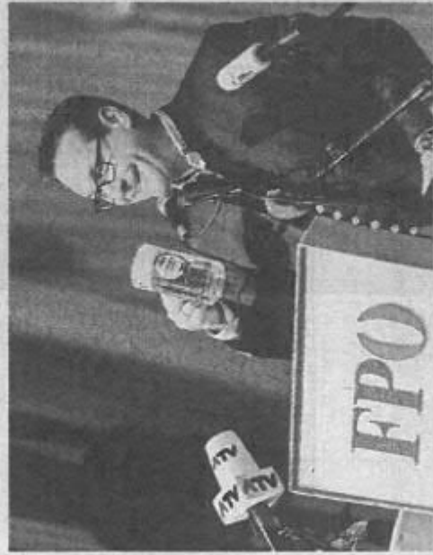
Austrijski vicekancelar Heinz-Christian Strache

Na video snimci objavljenoj na društvenim mrežama, a nastala je tijekom manifestacije u listopadu, militanti krajnje lijeve organizacije »Linkswende jetz« (Nalijevo odmah sada) nabrojali su niz razloga