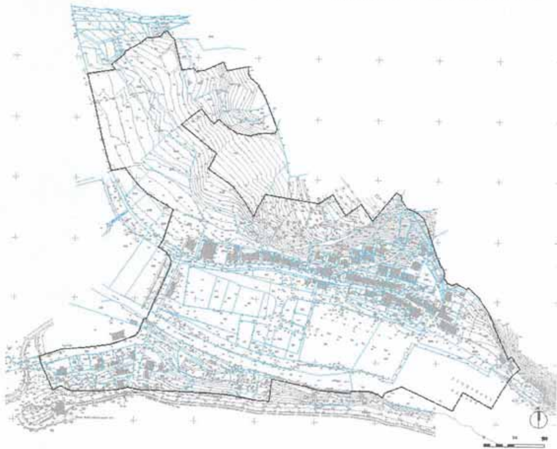
Obuhvat Plana utvrđen ovom Odlukom o izradi (prikazan na topografsko-katastarskoj podlozi)