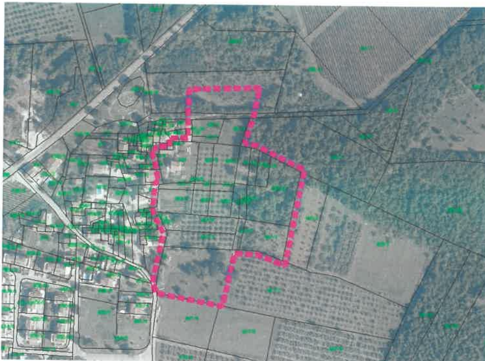
Obuhvat UPU dijela naselja Gedići prikazan na preklopu DOF-a i katastarske podloge