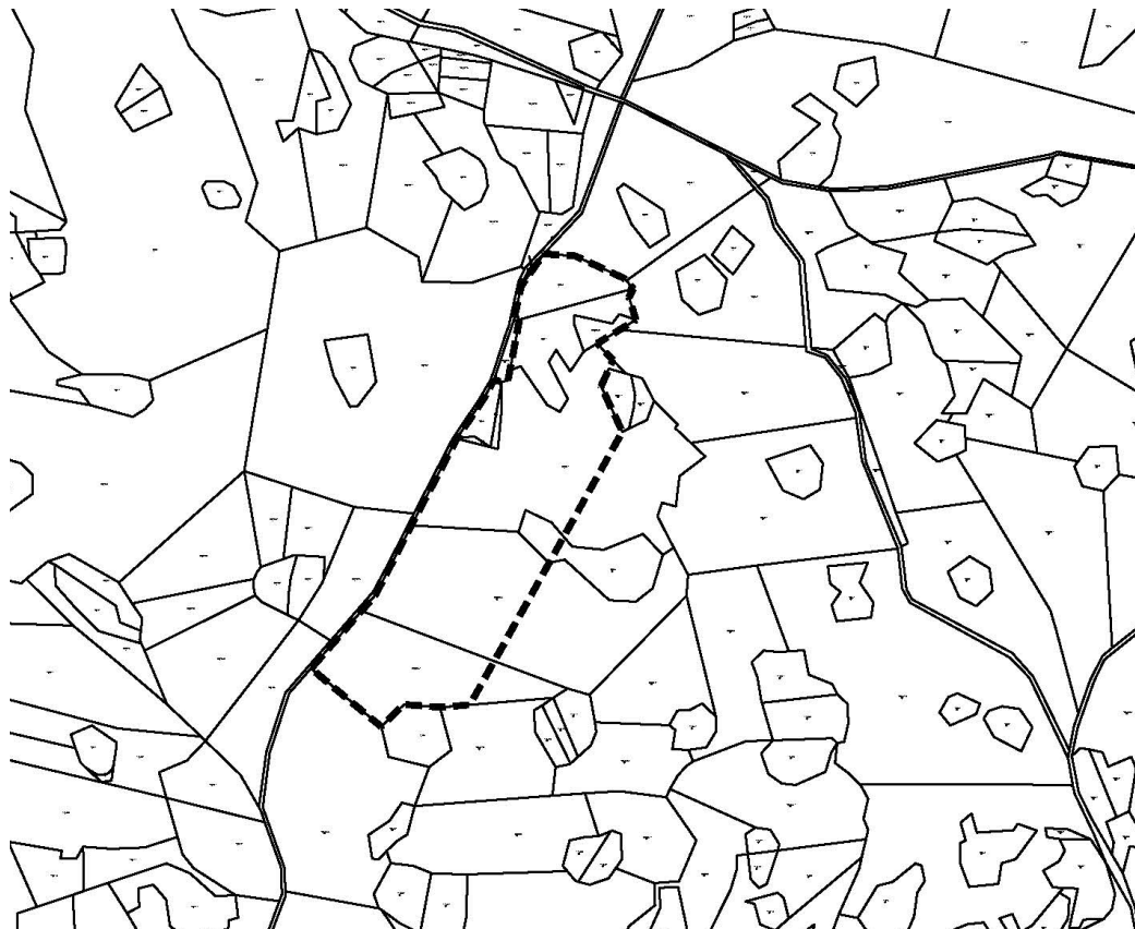
Slika 2.a. Novo građevinsko područje gospodarske namjene izvan naselja – naselje Rudani, (obuhvat prikazan crnom isprekidanom linijom; približna površina iznosi 4 ha)