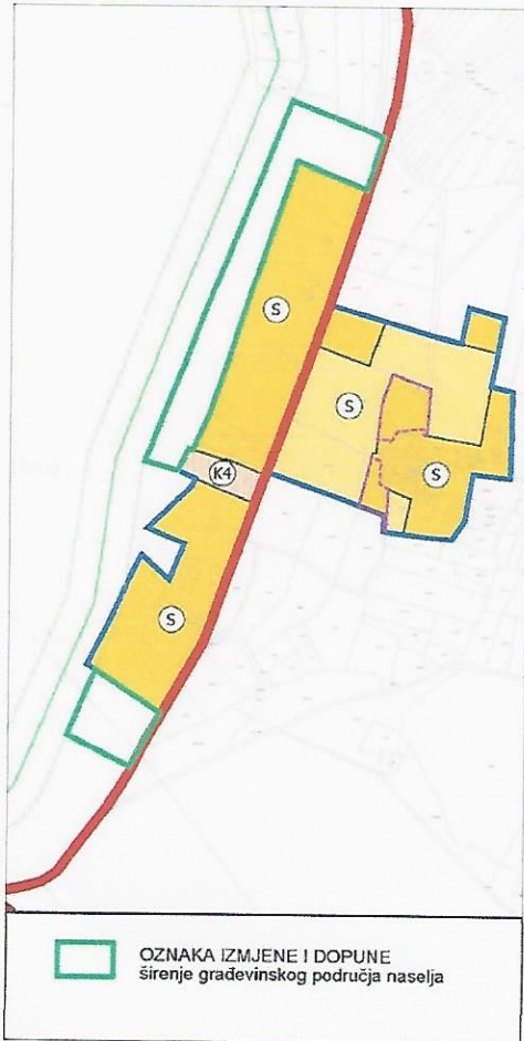
Prilog 1: Naselje Dazlina