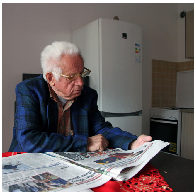
Lijevo: Korisnici na svečanom obilježavanju početka radova na izgradnji zgrade u Korenici, lipanj 2014. Desno: u novom domu, rujanj 2015.