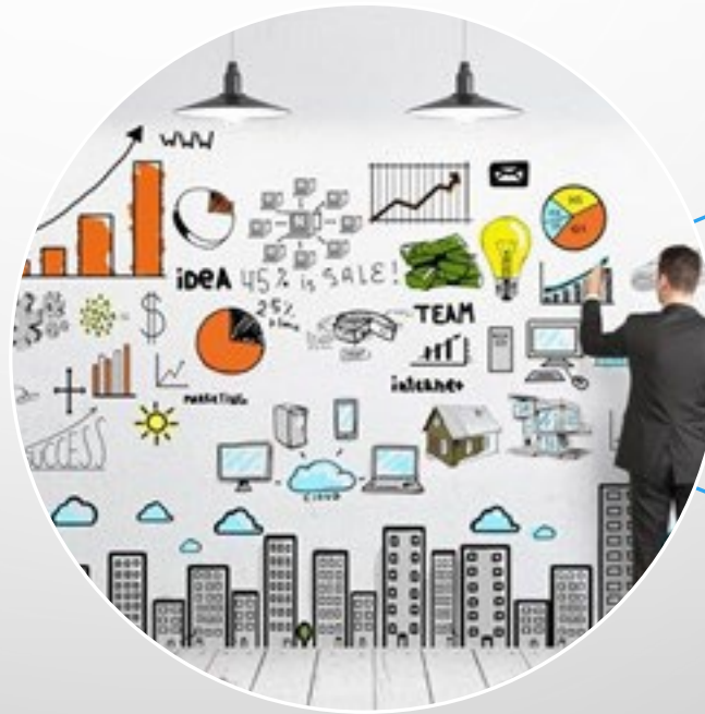
Upravljanje državnom imovinom

Ministarstvo prostornoga uređenja, graditeljstva i državne imovine