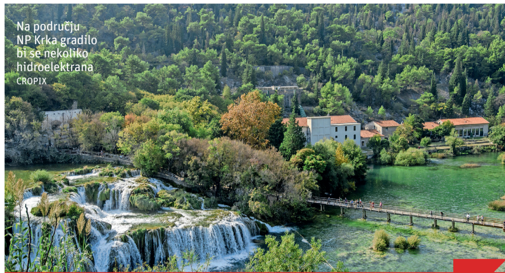
Na području NP Krka gradilo bi se nekoliko hidroelektrana