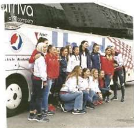
RUKOMETAIŠICE HRVATSKE krenule su jučer na završne pripreme za Europsko prvenstvo koje počinje 4. studenog