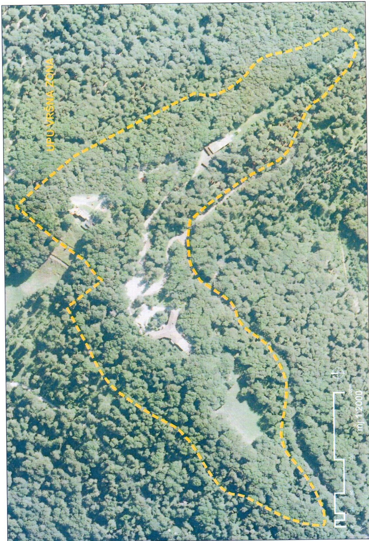
Obuhvat UPU "VRŠNA ZONA" prikazan na digitalnoj ortofoto karti u mjerilu 1:2000