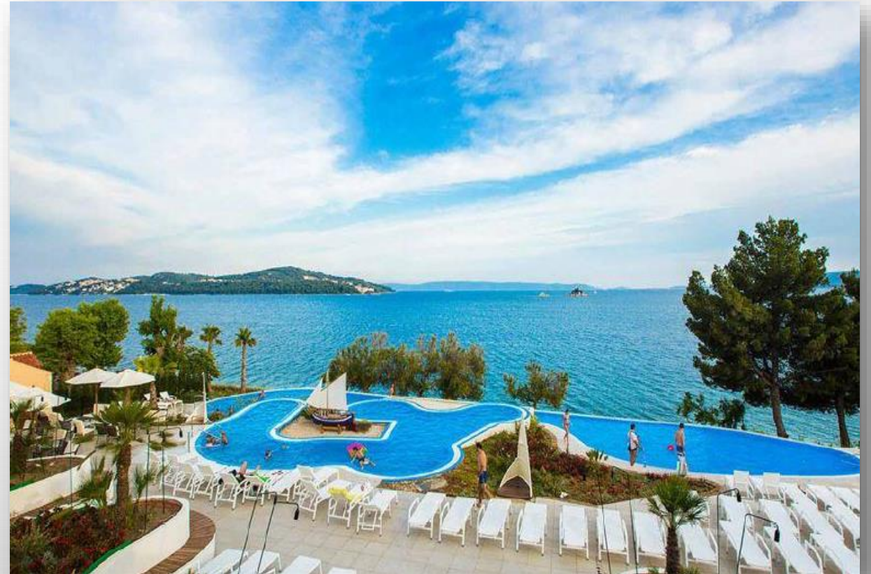
Kamp Vranjica Belvedere, Trogir