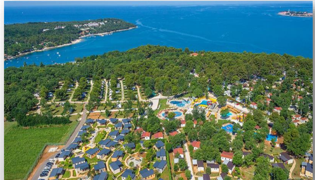
Kamp Lanterna, Novigrad

Iznos jedinične cijene zakupnine umanjuje se dodatno: