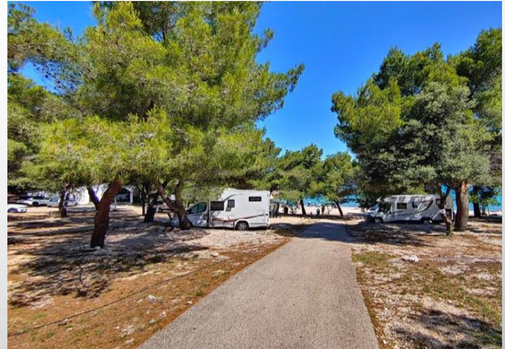
Kamp Jazina, Tisno