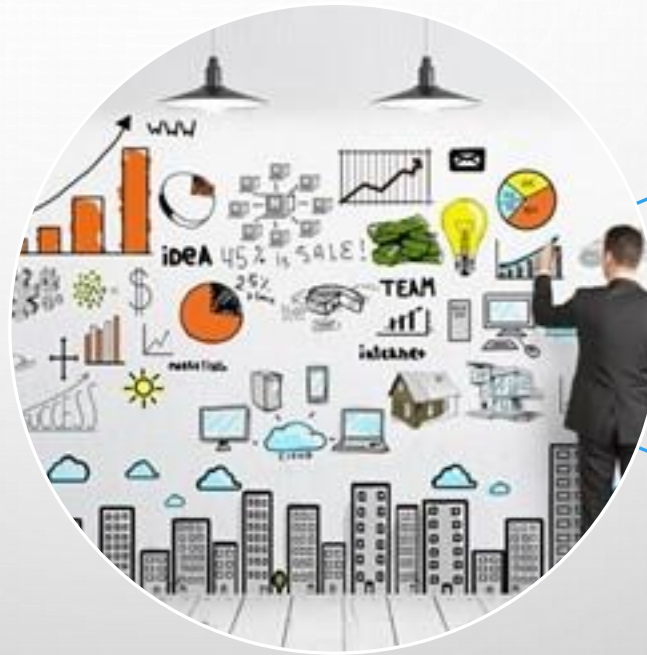
Upravljanje državnom imovinom

Ministarstvo prostornoga uređenja, graditeljstva i državne imovine