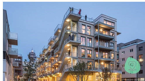
Gleis 21, Austria | New European Bauhaus Award winner 2022

Europska komisija pokrenula je inicijativu krajem 2020., a prva dva izdanja nagrada za novi europski Bauhaus za 2021. i 2022. pokazala su da se lokalne zajednice mogu udružiti i pronaći kreativna rješenja koja poboljšavaju naše živote. Nakon spomenuta dva uspješno provedena natječaja, Europska komisija će i ove godine ponovno nagraditi primjere izvrsnih projekata i ideja koji okupljaju ljude u zamišljanju i izgradnji zelene i održive budućnosti.